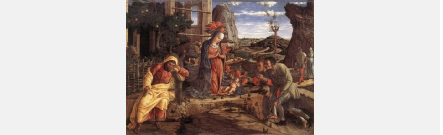
Adorazione dei pastori, Andrea Mantegna, 1451 ca.

di midrash aggadici»), ci consente di penetrarne il senso nascosto e di gustarne il messaggio autentico: «più andiamo a fondo in questi testi, più essi diventano affascinanti».